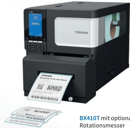
BX410T mit optionalem Rotationsmesser