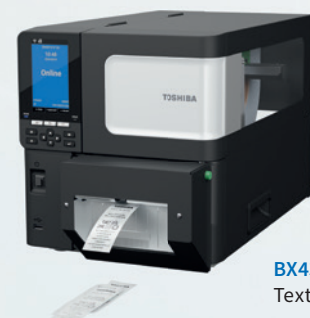
BX430T mit optionalem Textilmesser