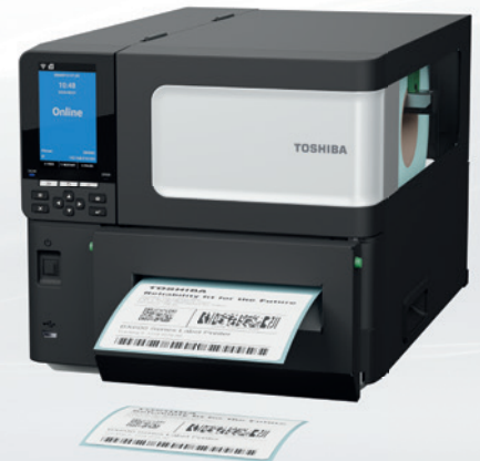
BX610T mit optionalem Rotationsmesser